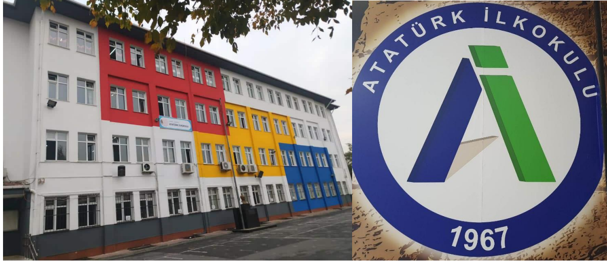
Fotoğraf 3: Yeni okul binamız ve mavi yeşil renkleriyle harf tasarımından oluşan yeni okul armamız

30/03/2012 tarih ve 6287 sayılı 'İlköğretim ve Eğitim ile Bazı Kanunlarda Değişiklik Yapılmasına Dair Kanun'la okulumuz 2012-2013 eğitim-öğretim yılından itibaren ilkokula dönüştürülmüştür. 2012-2013 eğitim öğretim yılında okulumuz "Atatürk İlkokulu" adıyla eğitim öğretimini sürdürmüş olup ilkokul ve ortaokul öğrencileri birlikte eğitim görmeye devam etmişlerdir. Bir sonraki eğitim öğretim yılı olan 2013-2014 Eğitim-Öğretim Yılı'nda ise 6, 7 ve 8. Sınıflar Güngören İmam Hatip Ortaokulu'na nakledilmiş olup Güngören İmam Hatip Ortaokulu'ndaki 2, 3, ve 4. sınıf öğrencileri okulumuza kaydedilmiştir.