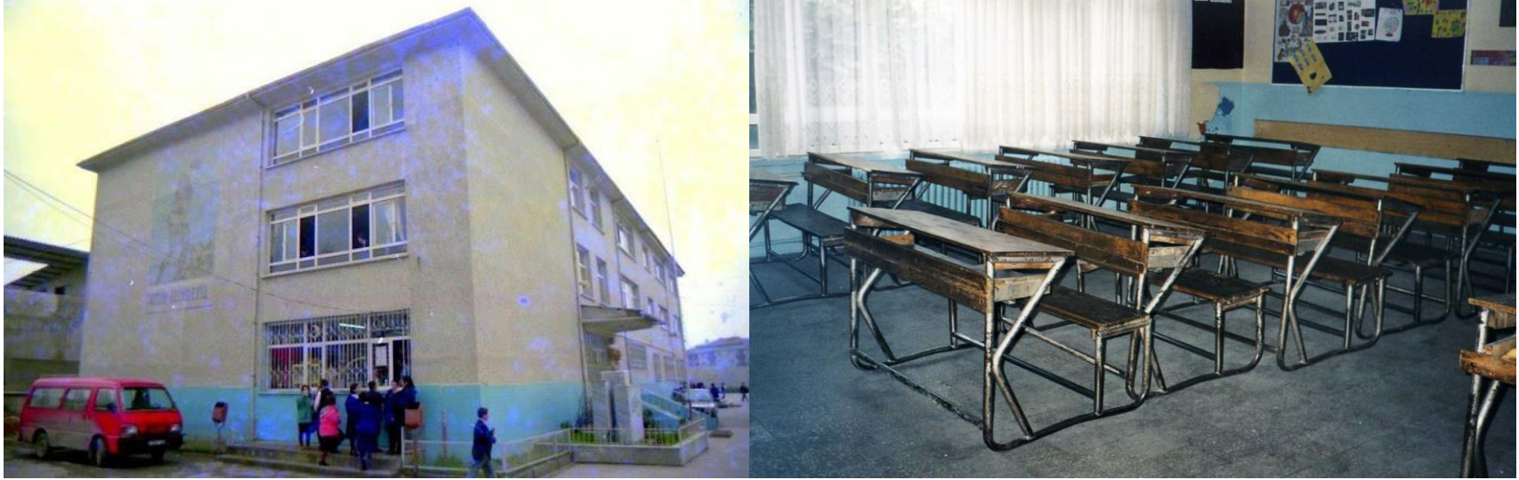
Fotoğraf 1: Okulumuzun eski binasının ve sınıflarının fotoğrafları

1974 yılı ile 1990 yılları arasında şu anki mevcut arsada bulunan 7 derslikli binada, bağımsız ortaokulu olarak eğitim öğretime devam eden okulumuzun fiziksel koşulları, mevcut öğrenci sayısındaki artışa karşın yetersiz kalmasından ötürü Eylül 1988’de okul binasının sol tarafına bitişik olacak şekilde bir ek bina inşaatına başlanmıştır. Halkımızın destek ve yardımlarıyla yapılan bu bina, 1990-1991 eğitim öğretim yılında ilave 7 derslikle hizmete açılmıştır. Geniş bir arsa üzerinde kurulan okulumuzun bahçe duvarları 1992-1993 eğitim öğretim yılında tamamlanarak, bahçe yeşil alan düzenlemesi ve spor araçlarının ve alan düzenlemelerinin de yapılmasıyla 1994 yılında çocuk dostu bir okula dönüştürülmüştür.